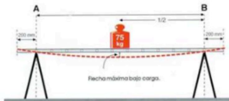
Ensayo a Flexión Máxima flecha bajo carga Se probaron todos los perfiles con resultados satisfactorios Señalando una deformación menor de la permitida